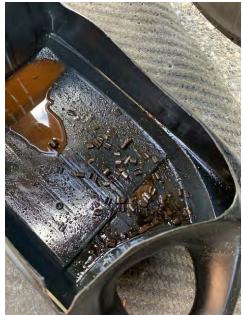
Reinigung – Bruchstücke der Kette