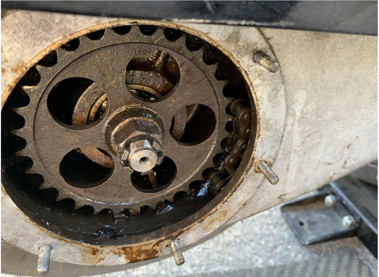
Blick in den Kettenkasten vor der Reparatur